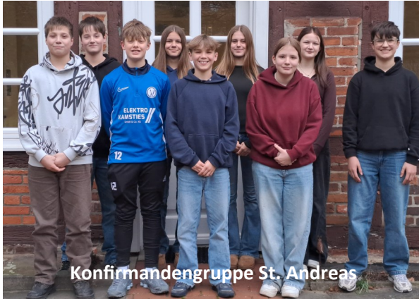
Konfirmandengruppe St. Andreas

Beide Konfirmandengruppen (St. Andreas, Domgemeinde) hatten im Februar Gelegenheit, Rückmeldung zu den bisherigen Erlebnissen und Erkenntnissen der Konfirmandenzeit zu geben. Dabei ging es um ihr Erlebnis in der Gruppe und den Umgang mit verschiedenen Methoden, ihre Teilnahme an den Gottesdiensten, beim Wahlpflichtprogramm (Konfitüre), über Themen, an die sie sich noch erinnern und um die Frage, ob sich ihr Verhältnis zum Glauben und zur Kirche entwickelt oder verändert hat. Es hat mir große Freude gemacht, die Rückmeldungen der Konfirmand*innen zu lesen und einige Auszüge möchte ich hier wiedergeben: „Mein Glaube hat sich nochmal verstärkt und ich fühle mich zu Gott, aber auch zu den Menschen hingezogen, wenn ich Lieder aus dem Liederbuch singe.“