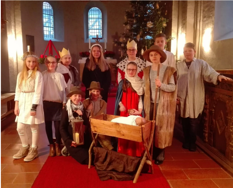
Viel beachtete Krippenspiele am Heiligen Abend