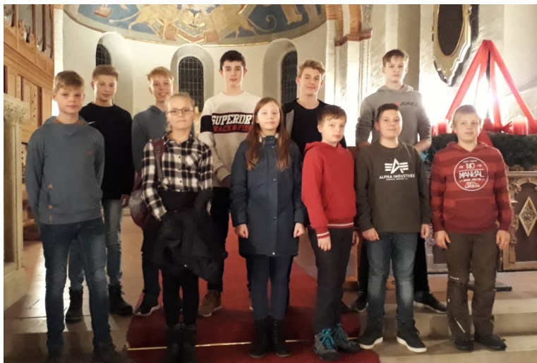
Lebendiger Advent in der Kirche mit guter Besucherzahl

Konfirmanden und Teamer haben sich in den letzten Monaten auf vielfältige Weise in das Gemeindeleben eingebracht. In verschiedenen Projekten haben die jungen Leute das Krippenspiel und eine Andacht vorbereitet, sie haben Bilder für die Ausstellung gemalt und einen Fotokalender mit den Monatssprüchen erarbeitet. Andere wiederum haben den Jugendraum gestrichen, haben auf Freizeiten als Teamer mitgewirkt, unterstützen im Konfirmandenunterricht und im Kindergottesdienst. Das alles sind zarte Pflänzchen. Da die jungen Leute viel um die Ohren haben, ist es gar nicht so einfach, sie alle unter einen Hut zu bringen. Der geplante Jugendraum in der Grünen Straße wartet noch auf Fertigstellung- vielleicht gelingt es bis zum Sommer, eine Einweihungsparty zu feiern.